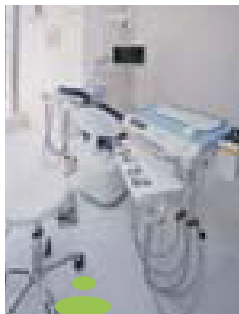
アニメDVDをご用意し 親子で見られる親子スペースも ありますよ!

女性医師ならではの観点より審美歯科、ホワイトニングなど特殊科目にも対応。今マスコミで話題のアンチエイジング歯科の分野においては、日本アンチエイジング歯科学会認定医としても活躍。また、当院は日本アンチエイジング歯科学会認定「ホワイトニングができる歯科医院」に認定されています。高齢者、有病者の患者様に対して誤嚥性肺炎の予防、味覚障害の予防、また往診も対応しております。