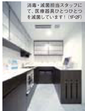
消毒・滅菌担当スタッフにて、医療器具ひとつひとつを滅菌しています! (1F・2F)

とてもわかりやすいアニメーションソフトや口腔内カメラを使用し、治療開始から終了まで患者様が納得いくまで治療方法を説明いたします。