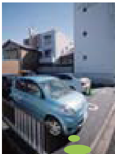
女性の方も安心です。広々とした、とても便利な隣接駐車場を完備。

大学卒業後、病気本態を探る為、研究にのめりこみ、愛知学院大学大学院にて歯学博士号を取得。アメリカ歯周病学会を始めとする多くの国際学会にて発表を行って参りました。大学院修了後は、じんの歯科クリニックで副院長を務めるかたわら、大学では助教として研究に取り組みH22年10月すぎうら歯科クリニックをリニューアル開院。現在、愛知学院大学 歯学部にて後輩に教育、指導し、歯科医師育成にも貢献しております。