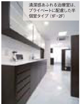
清潔感あふれる治療室は、プライベートに配慮した半個室タイプ (1F・2F)