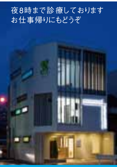
夜8時まで診療しております お仕事帰りにもどうぞ

スムーズな診察が出来るよう、7/19(木)より診察台(個室タイプ)を6台に増設しました。工事中はご迷惑をお掛けしました。