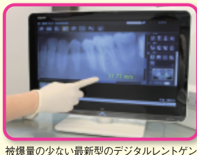
被曝量の少ない最新型のデジタルレントゲン