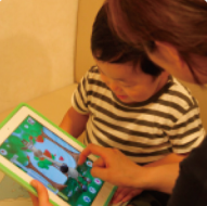
●iPadを待合室で利用(小さなお子様も大喜び)