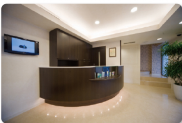
●シックで落ち着いた受付とエントランス