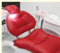
妊婦さんの負担も少ない「ふかふかチェアー」を導入!