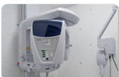
●被爆が極力少ない最新デジタルレントゲンシステム