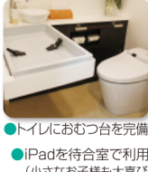
●トイレにおむつ台を完備