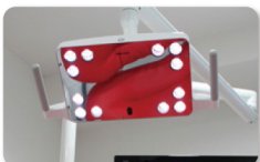
●最新のLEDでお口の中を照らします