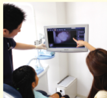
口腔内カメラにて治療前・後を親子で一緒に確認できます♪