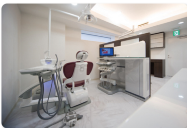
●患者さんのプライバシーを守る半個室タイプの診療ルーム