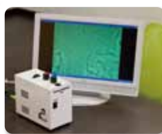
●顕微鏡検査で歯周病菌をチェック