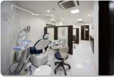
●患者さんのプライバシーを守る半個室タイプの治療ルーム