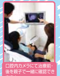
●口腔内カメラにて治療前・後を親子で一緒に確認できます

フッ素塗布 比較的高濃度のフッ素を直接歯に塗布することで、むし歯を予防します。 フッ素塗布の効果 1 歯質を強くする 2 むし歯菌の活動を抑える 3 歯の再石灰化を促進