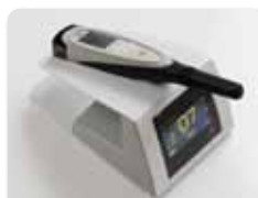
●隠れむし歯をレーザーを用いて発見