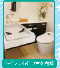
●トイレにおむつ台を完備

シーラント 奥歯の溝の部分に専用の樹脂を埋め込んで、むし歯を予防します。特に生えて間もない永久歯は、歯質が弱くむし歯になりやすい為効果的です。