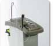
●最新レーザー治療を導入