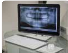
●最新型のデジタルレントゲンシステム を導入。体にやさしいレントゲン