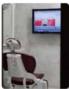
●プライバシーに配慮した完全個室 の特別診察室