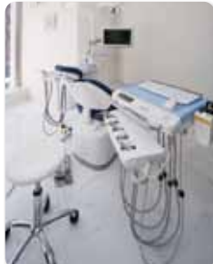
●治療の効率をあげる最新の 医療機器