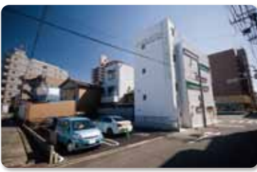
●専用駐車場+16台分コインパーキング有り