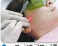
●レーザー治療(高度先進医療)で歯周病、知覚過敏、 顎関節症などに効果的