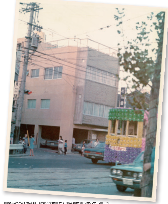
開業当時の杉浦歯科。昭和47年まで太閤通を市電が走っていました。

を続けて参りました。私の歯科医師としての目標は「街に必要な歯科医」になることと考えており、今後も今まで以上に、地域医療にスタッフ一同邁進していきます。 病気を治すには病気の本態を知る事が大切です 大学卒業後、国家試験に合格し歯科医になった際、今までの自分自身の勉強不足を痛感しました。そんな中、「まずは地域の皆様に必要とされる歯科医になろう」と目標を定め、病気を治す為には、まず病気を深く知る必要があると考え、そのものを深く知る必要があると考え、