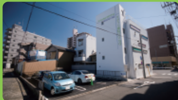
●専用駐車場+16台分コインパーキング有り