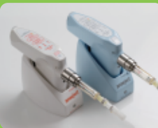
●麻酔が苦手な人も心配ありません。コンピュータ制御の電動麻酔器を導入。