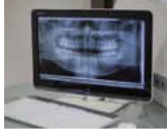
●体にやさしい最新のデジタルレントゲンシステムを導入。