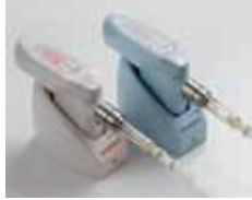
●麻酔が苦手な人も心配ありません。コンピューター制御の電動麻酔器を導入。