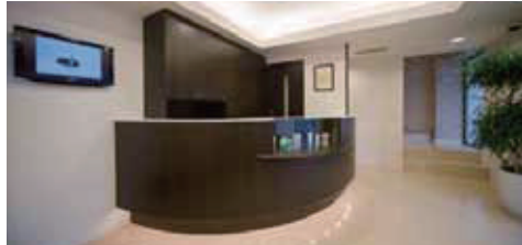
●シックで落ち着いた受付とエントランス