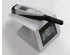
●隠れむし歯をレーザーを用いて発見