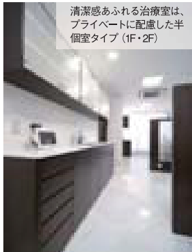
清潔感あふれる治療室は、プライベートに配慮した半個室タイプ(1F・2F)