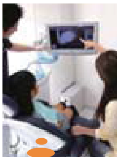
口腔内カメラにて治療前・後を親子で一緒に確認できます♪