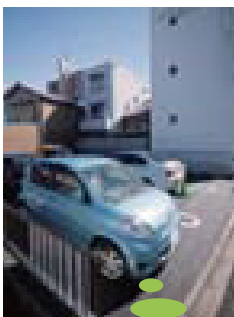
女性の方も安心。広々とした、とても便利な隣接駐車場を完備☆

大学卒業後、病気本態を探る為、研究にのめりこみ、愛知学院大学大学院にて歯学博士号を取得。アメリカ歯周病学会を始めとする多くの国際学会にて発表を行って参りました。大学院修了後は、じんの歯科クリニックで副院長を務めるかたわら、大学では助教として研究に取り組みH22年10月すぎうら歯科クリニックをリニューアル開院。現在、愛知学院大学 歯学部にて後輩に教育、指導し、歯科医師育成にも貢献しております。