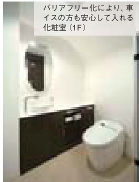
バリアフリー化により、車イスの方も安心して入れる化粧室(1F)

気持ちよくて、治療中に眠ってしまいます 柔らかく、包み込むような「ふっかふかチェア」を名古屋 ではいち早く導入しています。腰痛持ちの高齢者の患者様 にも好評です。